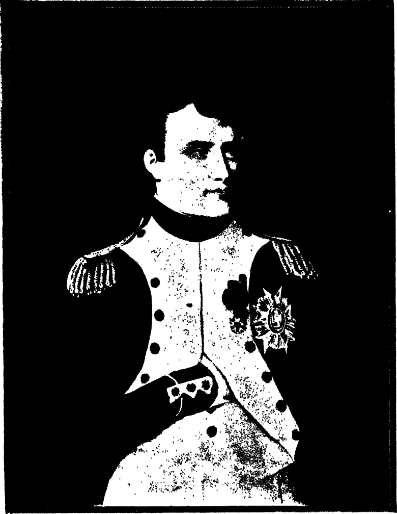
नपोलियन बोना पार्टे ।