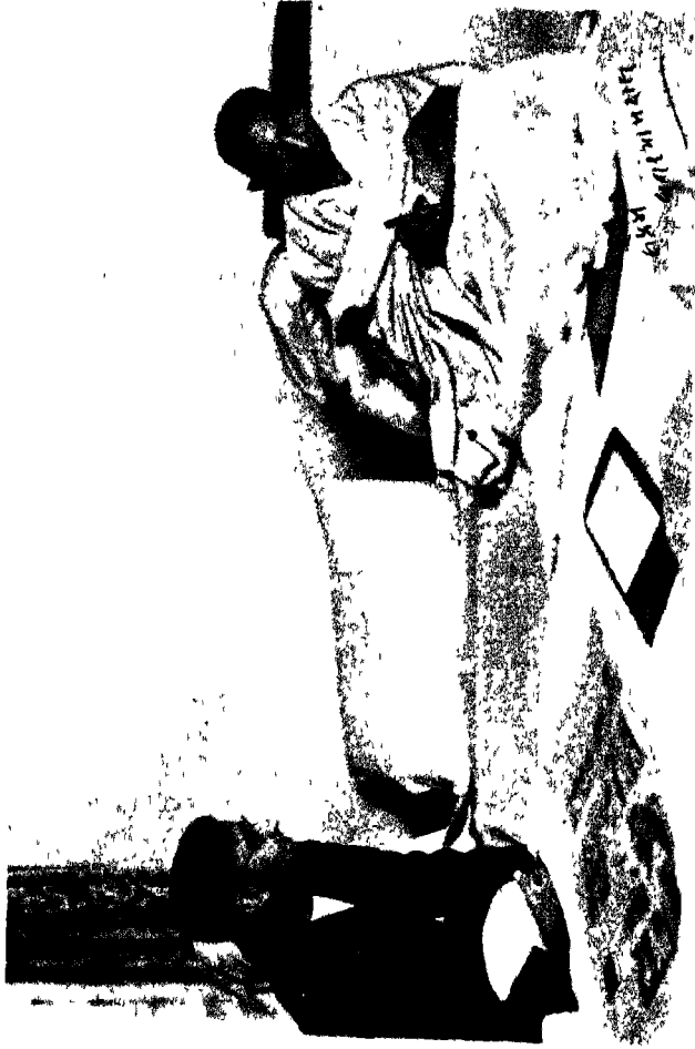
लेखक : गांधीजी के साथ आपनी ४६वीं वर्षगांठ पर : श्रीएमनवमी : संवत् १९९६