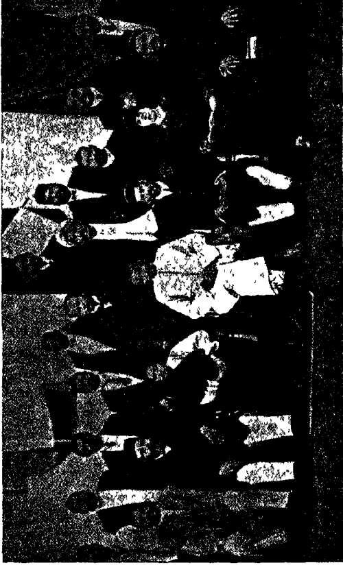
दक्षिण अफ्रीका से विदाई (सन १९१४)