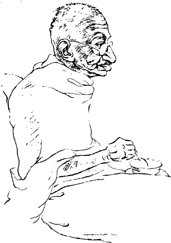
चित्रकार भूरसिंह, पिलानी