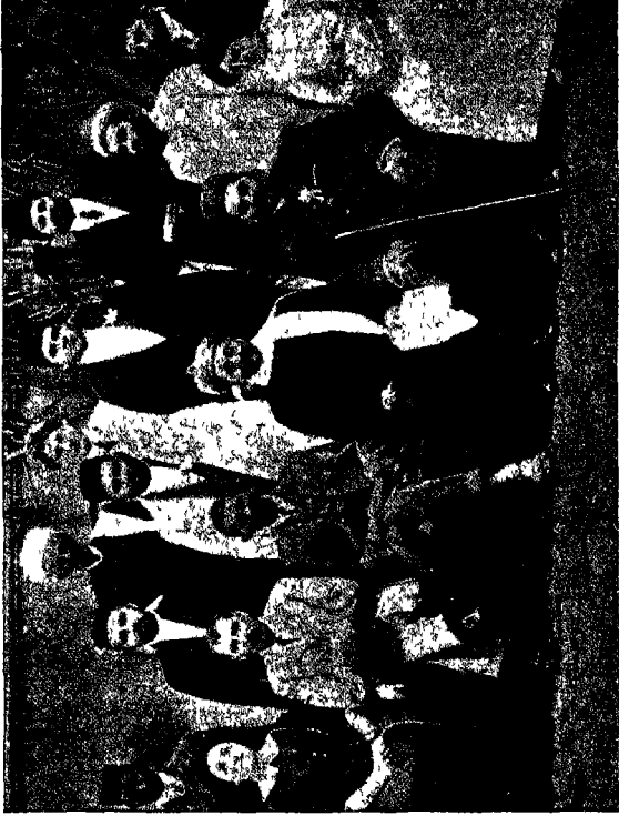
गोखले के स्वागत में—दक्षिण अफ्रीका ( सन् १९१२ )